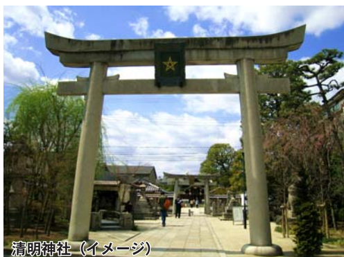
清明神社 (イメージ)