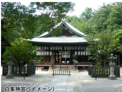
白峯神宮 (イメージ)