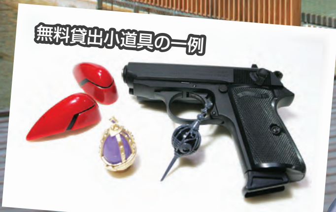
無料貸出小道具の一例